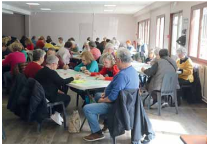
Jeudi 30 mars, loto pour les Seniors à la salle Jean Effel. Une fois encore, convivialité et bonne humeur étaient au rendez-vous...