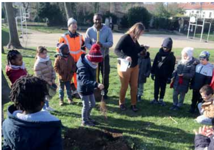
Dans le cadre de l'opération « La forêt s'invite à l'école », une classe de CP/CE1 de l'école Lucien Dauzié a planté lundi 13 février un tulipier de Virginie dans la cour de l'établissement.