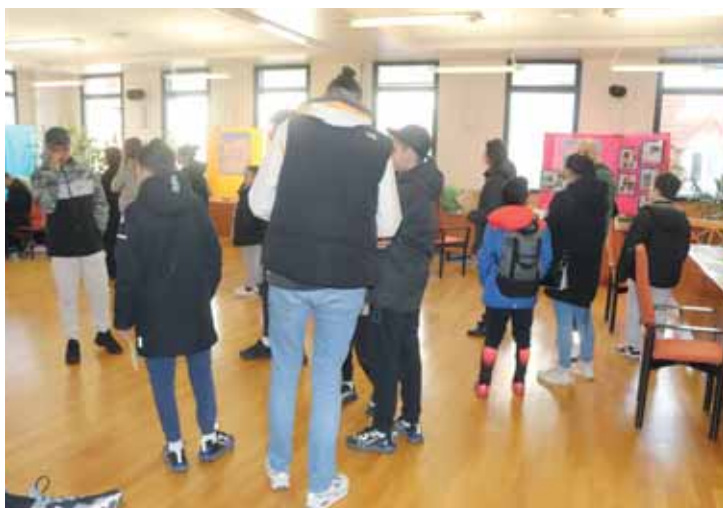
Lors du Forum de l'été samedi 18 mars à l'hôtel de ville, les familles campésiennes ont pu s'informer et rencontrer les organisateurs des séjours pour enfants et adolescents.