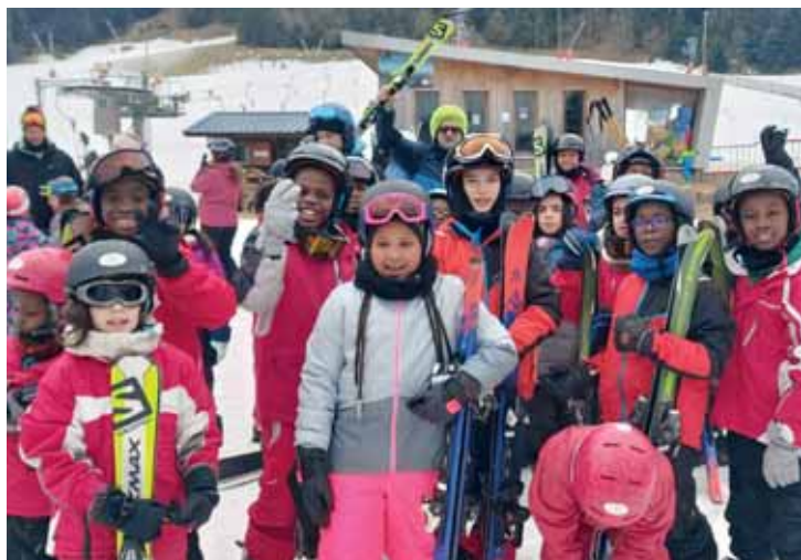
24 enfants des accueils de loisirs ont eu le bonheur de partir du 27 février au 3 mars pour un inoubliable mini séjour au ski au Tremplin de la Mauselaine à Gérardmer (Vosges).