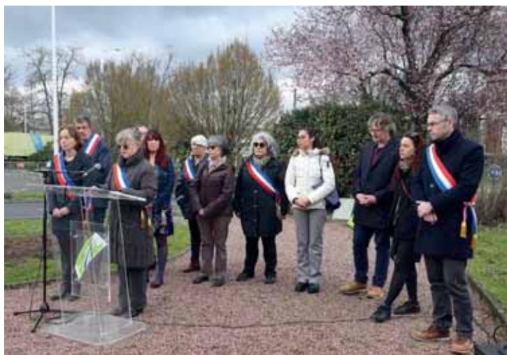
Dimanche 19 mars devant la Stèle du souvenir, commémoration en mémoire des victimes civiles et militaires de la guerre d'Algérie, ainsi que des combats en Tunisie et au Maroc.