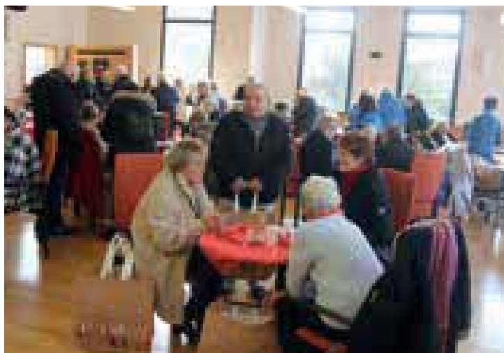
La distribution des colis de Fêtes en fin d'année est toujours l'occasion de passer un moment chaleureux avec nos Seniors campésiens. En particulier celle du 2 décembre à la mairie...