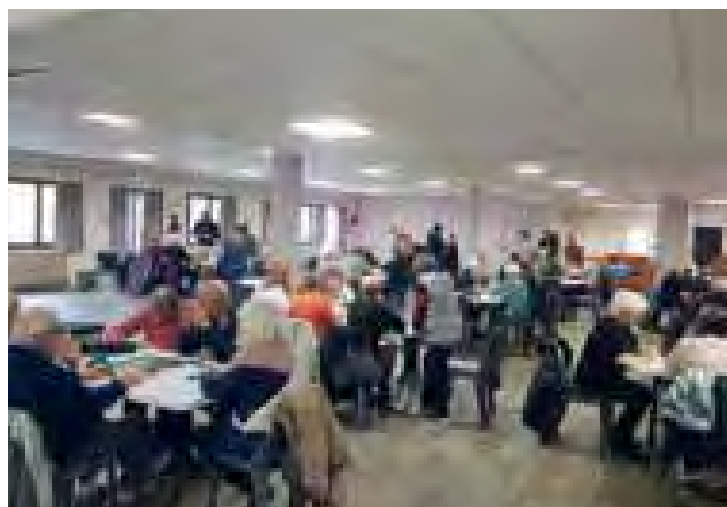
Mardi 21 novembre, bel après-midi jeux pour les Seniors qui ont pu jouer aux traditionnels tarot, Scrabble, belote, mais aussi à des jeux connectés proposés par l'association Delta 7.