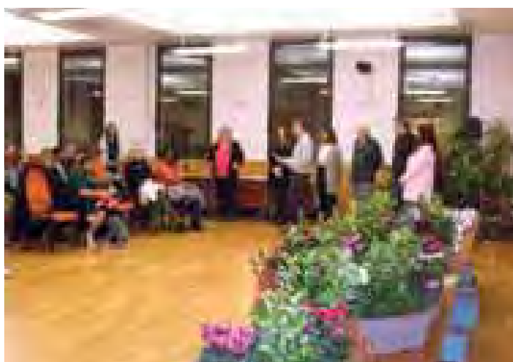
Vendredi 24 novembre, la Municipalité a remis à l'hôtel de ville les prix du concours des villes fleuries 2023. Bravo aux gagnants !