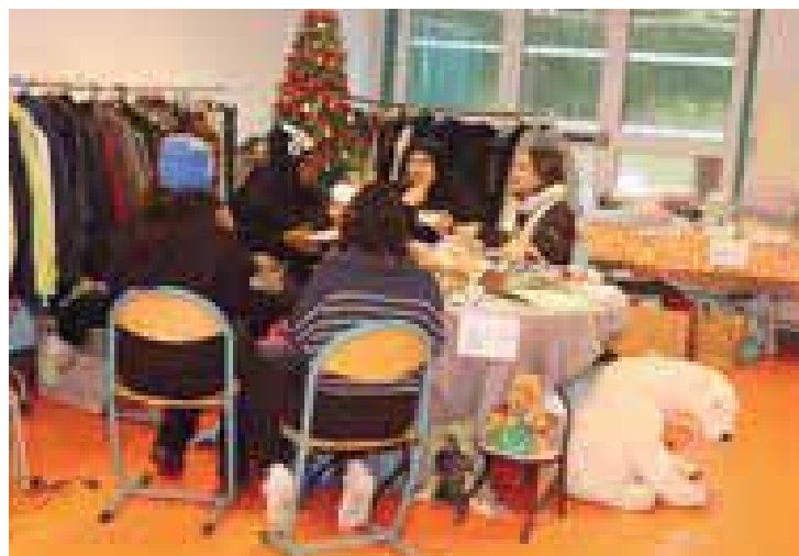
Samedi 9 décembre, l'Écolieu a organisé sa Gratifieria de Noël dans une belle ambiance conviviale avec les habitants.