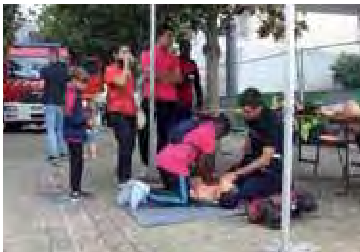
Samedi 18 novembre, 9 jeunes Campésiens ont pu suivre une formation gratuite aux Premiers Secours (PSC1) en collaboration avec la Fédération des Secouristes Français Croix Blanche de Gournay/Noisy-le-Grand.